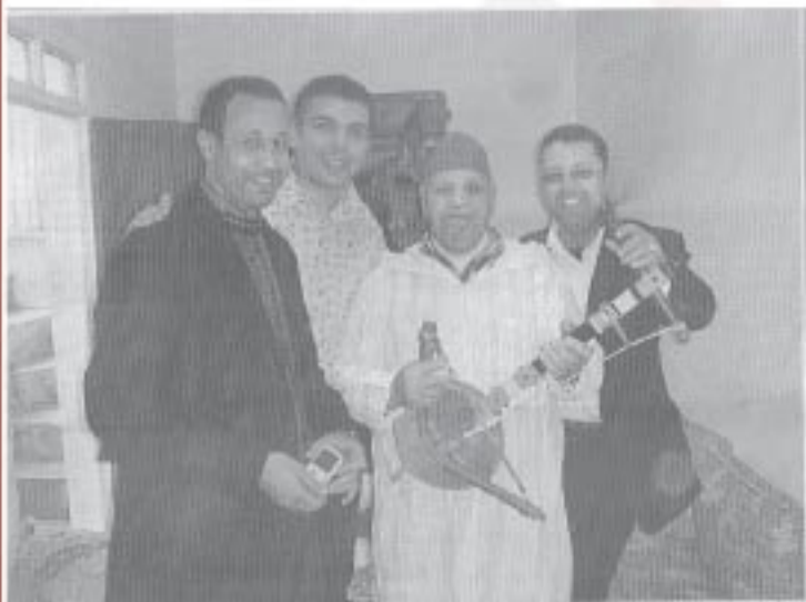
الرئيس السابق لجمعية الثقافة والفنون (الآن في باريس) مع أعضاء الجمعية في زيارة إلى جمعية الثقافة والفنون في باريس. من اليمين إلى اليسار: الرئيس السابق لجمعية الثقافة والفنون، الرئيس الحالي لجمعية الثقافة والفنون، الرئيس السابق لجمعية الثقافة والفنون، الرئيس السابق لجمعية الثقافة والفنون.