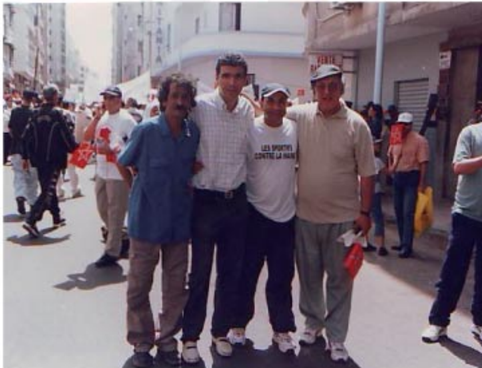
16 mai . marche Contre le Terrorisme