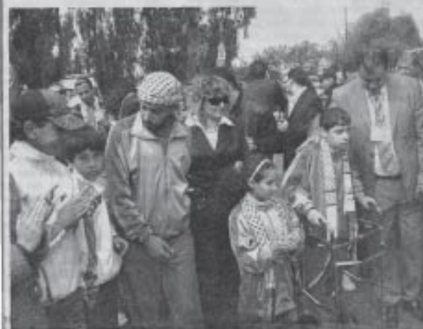
Un enfant de Gaza victime des derniers bombardements