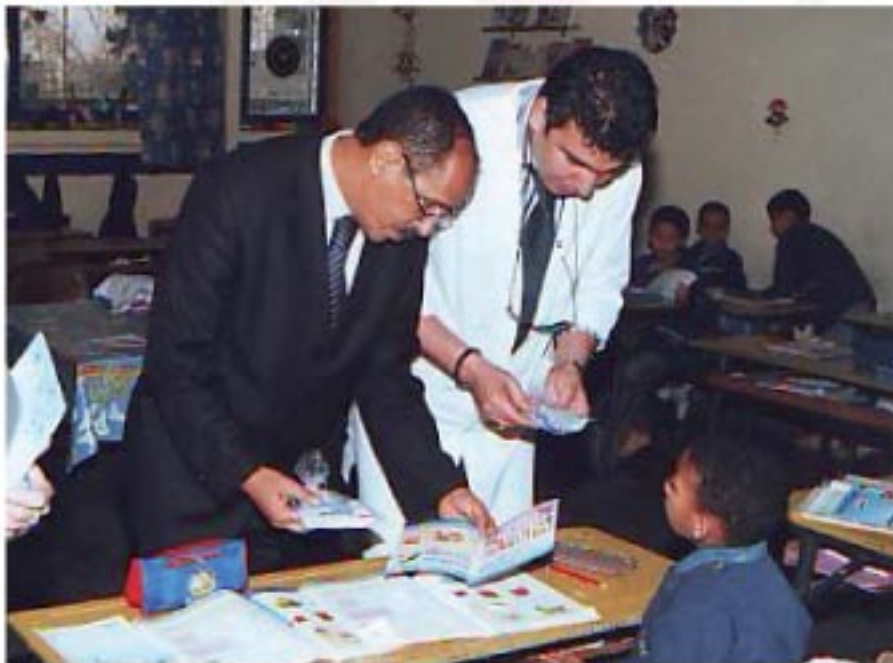
Compagne d'hygiène Bucco Dentaire à Fida pour 500 élèves en partenariat avec AMPBD (Association marocaine de Prévention Bucco Dentaire )