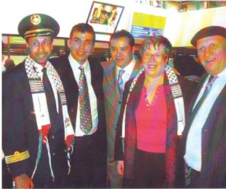
Membres de l'association Arts et Cultures avec madame la ministre Nezha SKALI