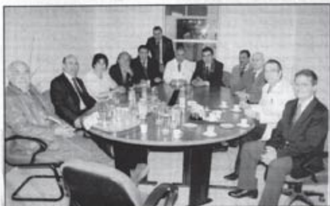
● بعض المشاركين في المبادرة

خاصة أن التعاون إياه الأمر في أولى محطاته. عملاً تطوعياً وإحسانياً استفادت منه 250 امرأة من جماعة دار بوعزة. مشيخاً أن هذا العمل جاء متطابقاً مع التوجه العام الذي ترسمه جمعية فن وثقافة، والتي تضع من أولويات اهتمامها مثل هذه المبادرات التطوعية المفتوحة في وجه مواطنين متحررين من مستويات اجتماعية ضعيفة ومتوسطة. كما تأتي هذه المبادرة كخطوة ثالثة في هذا المجال بعد تلك التي تم إنجازها مؤخراً بتراب عمالة الفخاء لثلاثة 200 امرأة، وبمراكش لثلاثة 500 لتلميذ. ولم يفت رئيس جمعية فن وثقافة أن يتوجه بشكره ودعم كل الفعاليات بدار بوعزة، وكذلك رئيس المجلس جمعية ريمستيك، وأخصبر العمل المنجز يأتي انسجاماً مع القناعة التي بدأت تترسخ في المجتمع الغربي والمجتمعي في ثقافة العمل الجماعي الهادف والمخرب في كل برامج التنمية الوطنية.