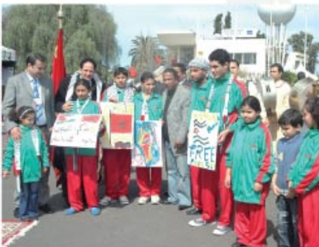
Organisation d'un atelier de peinture pour Les enfants de Gaza à l'aéroport Tit Mellil