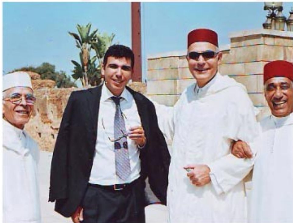
Visite au mausolée mohammed V