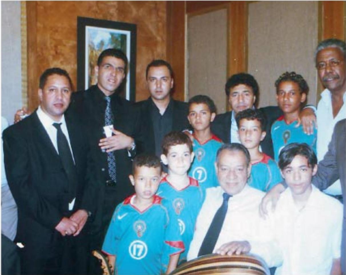
Hadj Abdelhadi Belkhayat