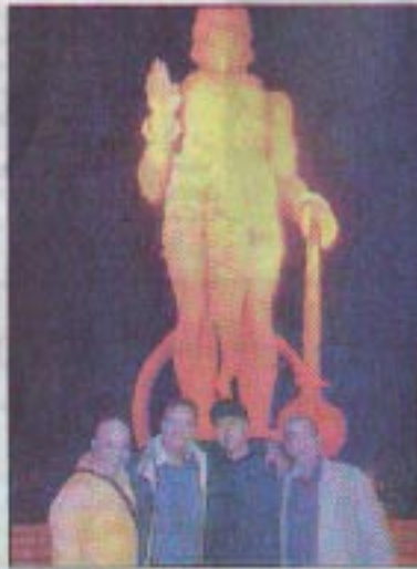
مغادر الفنان امير علي الذي شب وترجع بعزمته المحدثون على يد الرجال الفعير الحسن انكليسي. فهو اليوم يعتبر اليوم علامة موسيقية مغربية في الولايات المتحدة الامريكية. كما ان ابداعه الفني راسخ في الاسواق المغربية والعربية وبالتالي فهو يعتبر بحق سفيرا للموسيقى المغربية.

قد تستفيع الهيمالايا منع جنوب رباح الخاتباتك البرية للطننة من آسيا الوسطى لكنها حتى متردب تدعى موسيقي قادمة من بلاد تنال و الانكليسي والمحدون